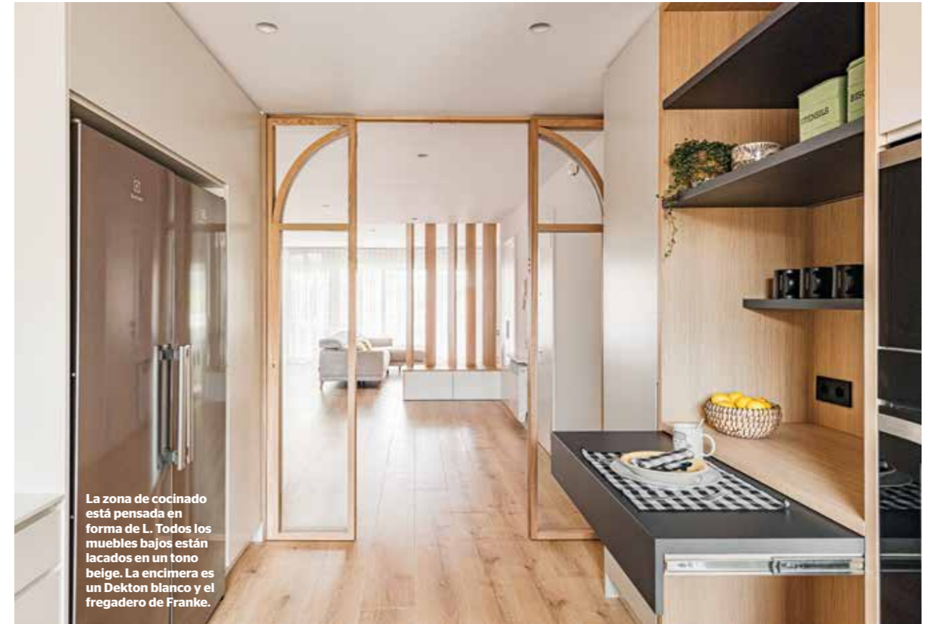
La zona de cocinado está pensada en forma de L. Todos los muebles bajos están lacados en un tono beige. La encimera es un Dekton blanco y el fregadero de Franke.