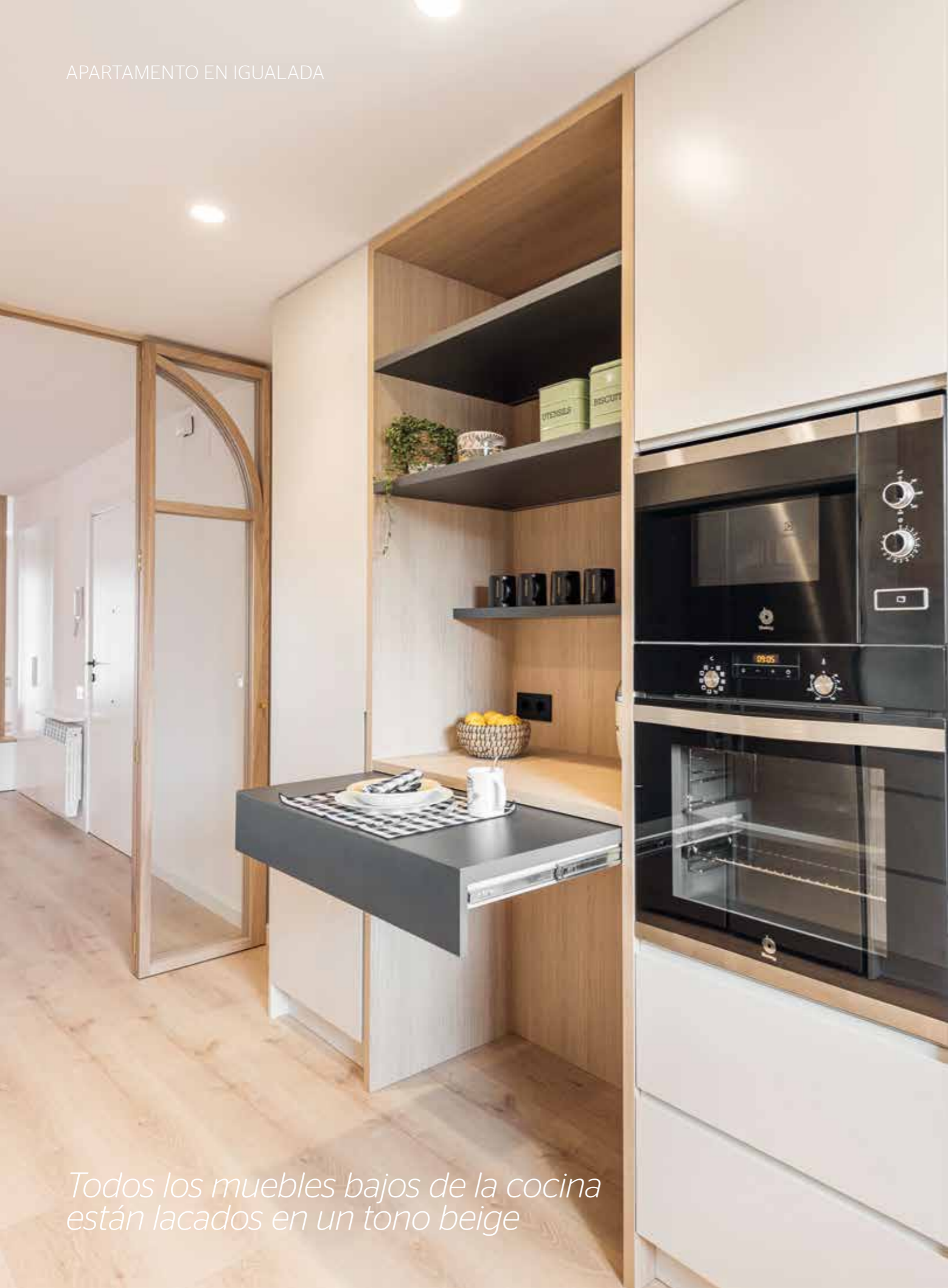
Todos los muebles bajos de la cocina están lacados en un tono beige