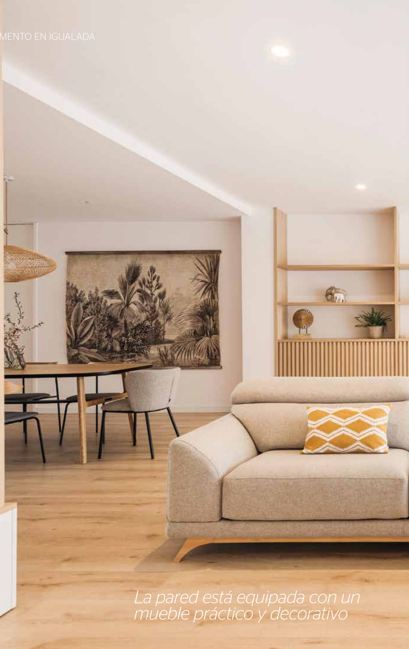
La pared está equipada con un mueble práctico y decorativo